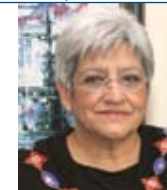
MAIS PERTO DE SI MARIA AUGUSTA DE SOUSA Bastonária da Ordem dos Enfermeiros

A saúde é transversal a todas as políticas e o PNS concentra a atenção e obriga a reflectir quem faz política de saúde ou de qualquer outra área. Pode ser apenas aplicado parcialmente, mas é um incentivo para avançar e um processo único na definição de objectivos, valioso e útil.